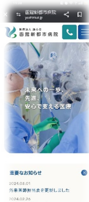
スマートフォン画面